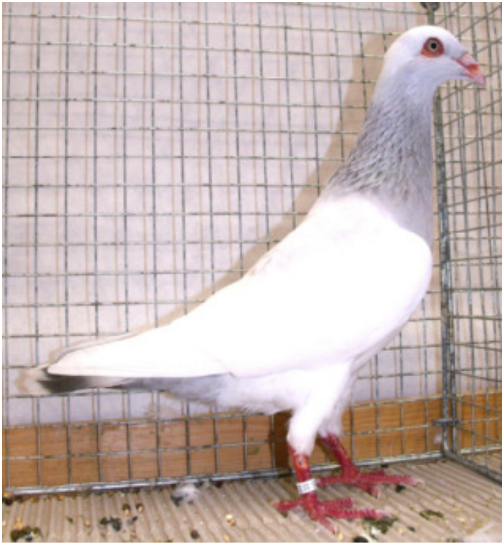
1,0 alt Elster perlfarbig „hv96“, Egon Kugele, Limeshain

weise schon sehr fein vorhanden, aber die Kopffarbe muss noch reiner werden, bei einigen Tieren war die Vorfarbe schon recht hoch angesetzt