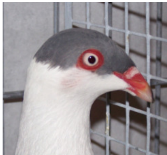
Kopfstudie Kalotten blau

Die getigerten Farbenschläge haben es nicht leicht das geforderte Zeichnungsbild mit farbigen Kopf, Oberhals, Hand- und Armschwingen sowie Schwanz, Decke und Keil aufzuweisen und dann auch noch den Typ mit allen Schwierigkeiten darzustellen. Bei den drei Schwarzen konnte das Zeichnungsbild gefallen, auch der dunkle Rand das helle Auge und die Schnabelfarbe stimmte. Insgesamt müssen sie in der Form noch kürzer werden, auch die Haltung sollte abfallender sein. Die Gesichtslänge war ausreichend vorhanden, etwas gezogener im Profil und der Vorkopf noch besser gefüllt. Der gelbe Farbenschlag mit 10 Tieren vertreten, zeigte sich in Figur und Haltung schon viel typvoller, es fehlte aber auch hier an Vorkopffülle. Schnabelsubstanz, Augen- und Randfarbe waren sehr gut. Das geforderte Zeichnungsbild noch nicht optimal. Auch bei dieser Zeichnungsart musste die Schwanzfederlage kritisiert werden. Eine junge Täubin von Detlef Stolze wurde mit 96 Punkten bewertet. Die Kalotten haben eine sehr positive Entwicklung in den letzten Jahren genommen. Mit insgesamt 32 Tieren in den Farbenschlägen schwarz, rot, gelb und blau konnten sehr feine Tiere bewundert werden, die Schwarzen sollten im Stand noch etwas freier auftreten und in der Halsführung nach oben noch besser verjüngen. Gesichtslänge, Schnabelsubstanz und Augenfarbe waren gut vorhanden, der Vorkopf muss sich noch