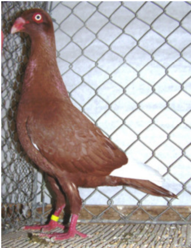
1,0 alt Weißschwanz rot „hv96“, Gerd Tschierschke, Gerstetten

1,0 alt Weißschwanz rot „hv96“, Gerd Tschierschke, Gerstetten Optimale zeigen. Für beide Farbenschläge wäre eine noch stabilere Haltung wünschenswert, positiv muss die Augen- und Randfarbe erwähnt werden. Hermann Schuller erreichte in beiden Farbenschlägen die zweithöchste Punktzahl. Die blauen Kalotten die größte Kollektion mit 15 Tieren, viele mit sehr guter Standhöhe und Halslänge kräftigen Schnäbeln und guter Augenfarbe, am Zeichnungsbild gab es nur wenige Wünsche, in der Farbe aber noch klarer im Blauton. 97 Punkte und 2x 96 Punkte konnte Hermann Schuller für sich verbuchen. Bei dieser Zeichnungsart aller Farbenschläge sollte auf noch kürzere Hinterpartie in der Zucht Einfluss genommen werden. Die Weißschwänze in gelb und rot wurden mit je sechs