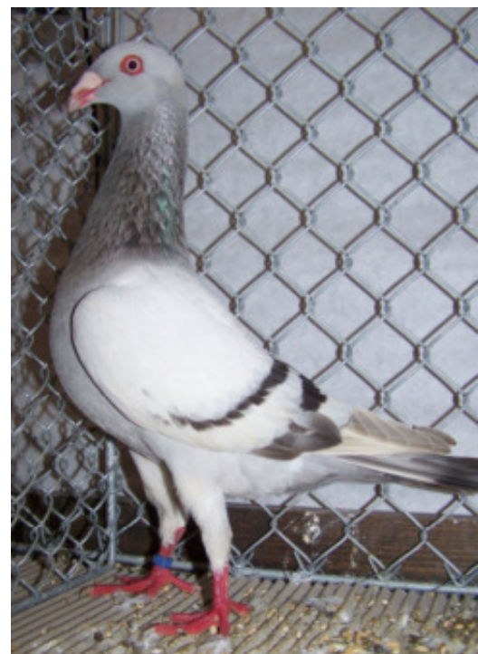
1,0 jung, blaufahl mit schwarzen Binden, Detlev Stolze, Pabsdorf

auch das Zeichnungsbild exakt und in der Farbe schon sehr gleichmäßig.