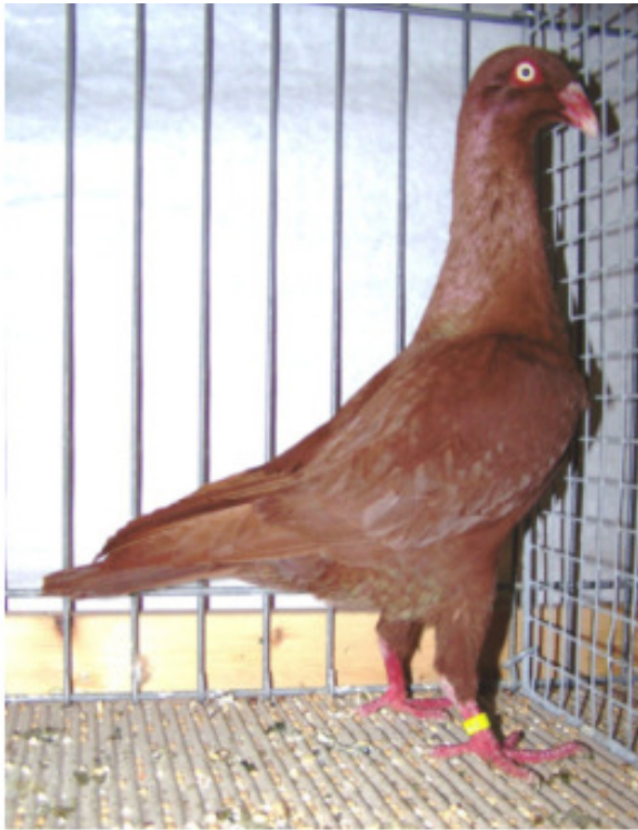
1,0 alt Einfarbig rot „sg95“, Lothar Winter, Seligen-

96 Punkten bei 0,1 alt die Spitzentiere. Bei den Roten waren sehr typvolle