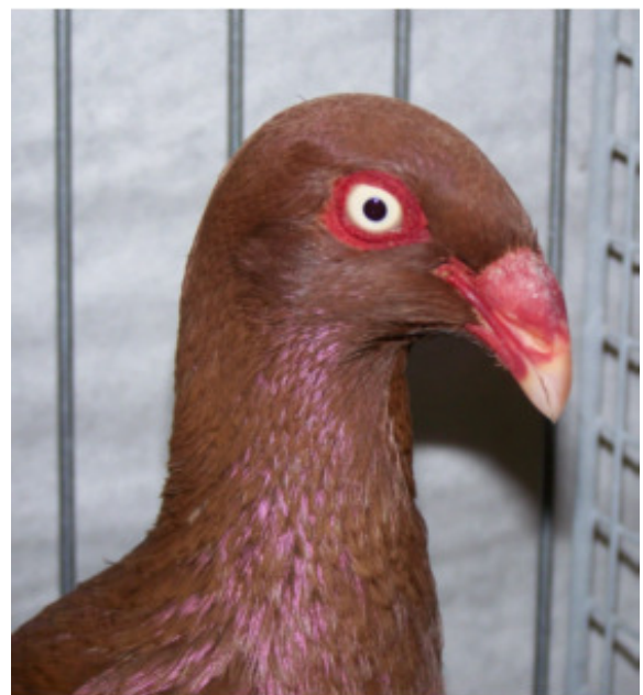
Kopfstudie Einfarbig rot

Mit nur 312 Tümmelern sollten wir uns nicht zufriedengeben, etwas mehr Werbung in den eigenen Reihen würde die Anzahl der Tiere zur HSS doch erhöhen. Die Elstern in schwarz 13, in rot 18, in gelb 17, in blau 13, in perlblau 10 und in der AOC Klasse in dun 4. zeigten sehr gut den zur zeitigen Zuchtstand auf. Bei den Schwarzen hat sich die Haltung etwas verbessert auch die Abstimmung nach hinten harmonischer, teilweise etwas mehr Vorkopffülle und bei der Augenfarbe noch eine kleine Nuance heller. Bei der Farbe und Zeichnung gab es keine Ausfälle, Reiner Reichardt stellte mit 97 Punkten bei 1,0 alt und